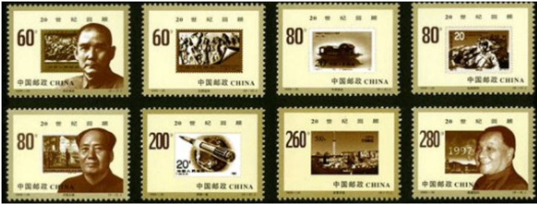
图 《世纪交替 千年更始——20 世纪回顾》纪念邮票