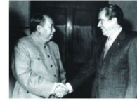
图一毛泽东会见美国总统尼克松

●唐朝与 ▲ (民族) 订立盟约，并专门刻会盟碑，表明世代友好。此碑至今仍屹立在拉萨大昭寺门前。 ●宋与 ▲ (政权) 签订澶渊之盟后，双方在边境地区开展贸易，此后很长时间，双方保持和平局面。