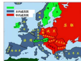
图三：北大西洋公约组织 和华沙条约组织

图三:第二次世界大战后，美国成为世界上军事、经济实力最强大的国家，称霸世界的野心日益膨胀，二战后强大起来的社会主义国家苏联成为美国实现野心的障碍，为了遏制苏联为首的社会主义阵营，美国出台冷战政策，在军事上成立了北大西洋公约组织；(1分)