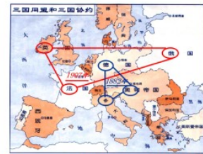
图二：三国同盟和三国协约

答: 图二:第二次工业革命后，主要资本主义国家先后进入帝国主义阶段，帝国主义国家出现了政治经济发展的不平衡；(1分)