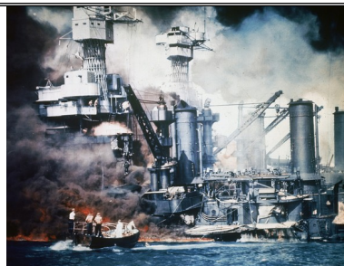
图2 1941年12月7日美国遭到偷袭，188架飞机被毁，155架受损，2艘军舰瘫痪，2403人死亡，1178人受伤。