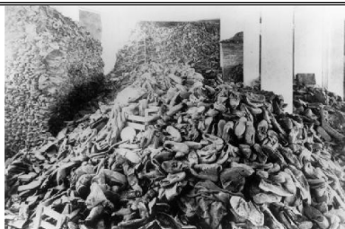
图3 1945年1月27日苏联解放波兰奥斯维辛集中营，发现被屠杀者留下的鞋子堆积如山。二战中被屠杀的犹太人达600万。