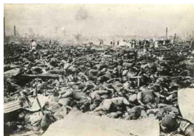
图4 广岛原子弹后横尸遍野，一片废墟，24.5万人中7.8万人当日死亡，受核辐射残害致死者已近20万。

材料二：南京街道极为平静。……九死一生地逃出来的难民们，受到了日本军的亲切抚慰。……在难民区内，他们（日本兵）不问性别、年龄，给难民分送面包、点心、香烟等，大家感到非常高兴，表示感谢。