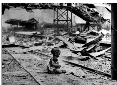
图1 1937年8月28日上海南站儿童，当时车站有1800余人，被炸死250余人，炸伤500余人，交通枢纽瘫痪。