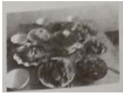
20世纪五六十年代食物匮乏的农村生活