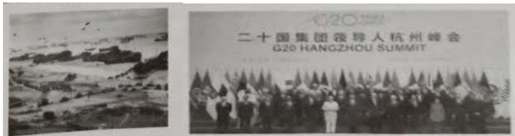
诺曼底登陆 2016年二十国集团领导人杭州峰会举行