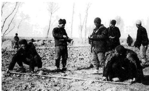
翻身农民丈量分配土地