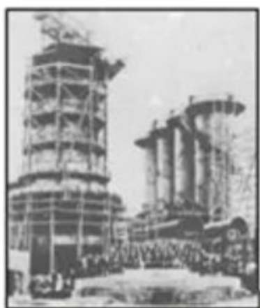
八幡制铁所（钢铁厂）