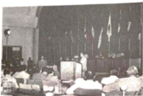
周恩来在万隆会议上发言