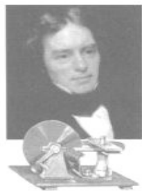
法拉第与电磁感应实验