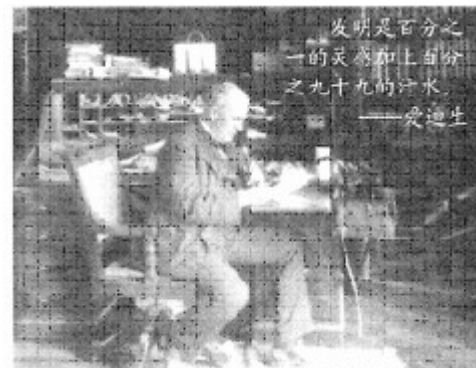
“发明大王”的工作坊兼卧室

材料三：李四光创立地质力学，提出陆相成油理论，让黑土地上涌出滚滚石油，使中国摘掉了“贫油国”的帽子；袁隆平发明的杂交水稻，一直处于全球领先地位，为我国粮食增产发挥了重要作用；潘建伟院士及其团队，在广域量子通信和光学量子信息处理等领域取得的一系列具有重要国际影响的原始创新成果，被英国《自然》杂志称为“这标志着中国在量子通信领域的崛起，从10年前不起眼的国家发展成为现在的世界劲旅，将领先于欧洲和北美……”