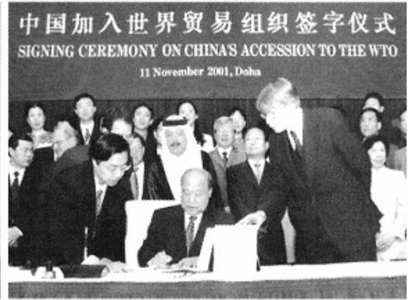
图二 2001年11月11日，中国代表团团长石广生在中国入世议定书上签字