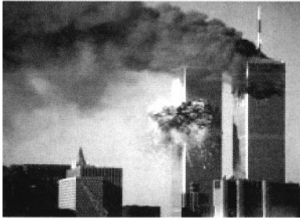
图一 2001年9月11日，美国遭受恐怖袭击，即震惊世界的“9·11”事件