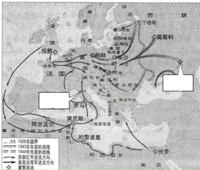
1943—1945年的欧洲、北非战场示意图

18.观察《1943—1945年的欧洲、北非战场示意图》，请将下列地点的英文字母代号填写在答题卡图中对应的方框内。