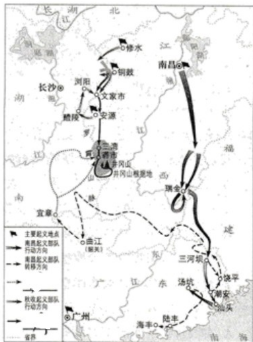
南昌起义、秋收起义和井冈山会师示意图