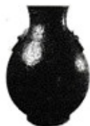
③刻有水陆攻战图案的战国铜壶