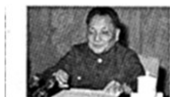
图 4 邓小平在十一届三中全会上