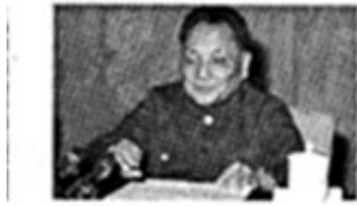
图4 邓小平在十一届三中全会上