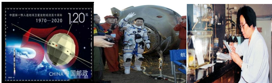
图1 图2 图3

(2) 图1 邮票纪念的“中国第一颗人造地球卫星”的名称是什么？图2 成就说明我国在航天技术上居于怎样的地位？图3 人物 2015 年在国际上获得了哪项大奖？