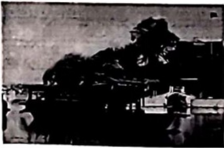
中共一大会址嘉兴南湖游船