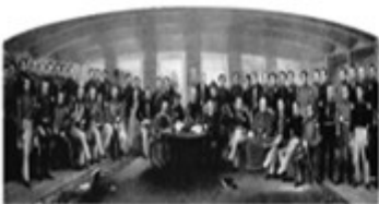
图 1 《南京条约》签字