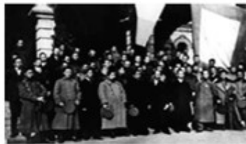
图 2 中华民国成立