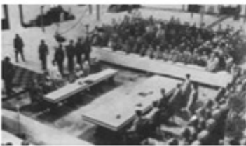
图 3 日本在南京递交投降书