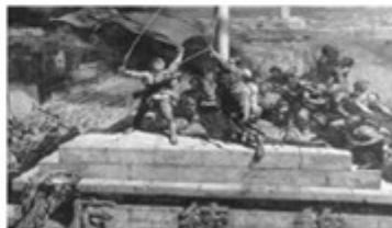
图 4 人民解放军占领南京

(1) 图 1 中的《南京条约》是哪次战争失败后清政府被迫签订的？（1 分）这次战争对中国社会产生了什么重大影响？（2 分）