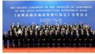
亚投行协定签署仪式