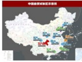
自由贸易试验区示意图