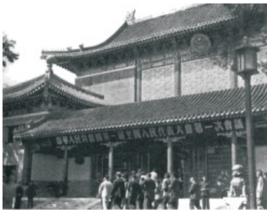
人民代表步入第一届全国人民代表大会第一次会议会场