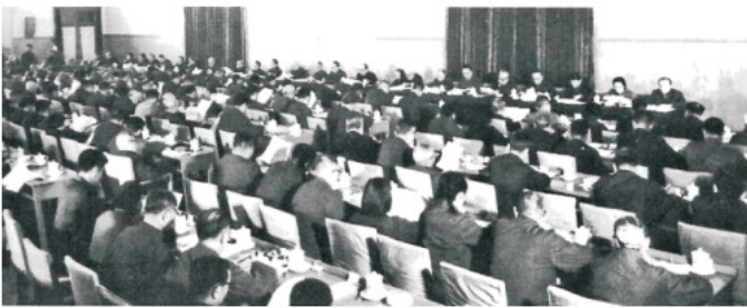
中共十一届三中全会会场

(3) 用史实说明，中共十一届三中全会是建国以来党的历史上的伟大转折。（答一点即可。）