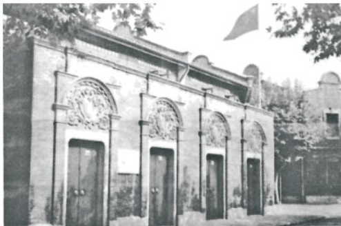
中国共产党第一次全国代表大会上海会址

(1) 据以上图片，结合所学知识回答，中共“一大”确定的党的中心工作是什么？“一大”召开有什么重大历史意义？