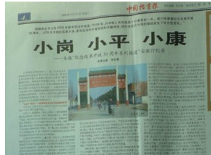
图一 《人民日报》1978年12月24日 刊登的中共十一届三中全会公报 图二 《中国档案报》2008年4月21日 刊登的《小岗 小平 小康——本报“纪念