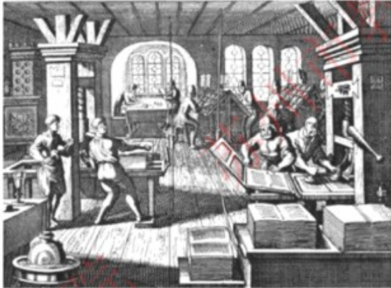
15世纪中期约翰·古腾堡发明铅活字印刷机

(1) 读材料一.敦煌莫高窟造像体现了中华文化与哪一宗教文化的融合?徐光启等人主要学习了西方哪些学科门类的先进知识?