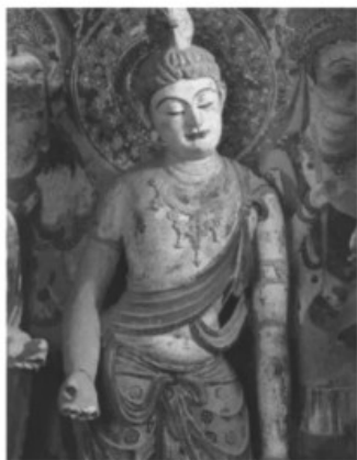
敦煌莫高窟第 45 窟菩萨(盛唐)

万历年间，徐光启与利玛窦在北京合作翻译了欧几里得的《几何原本》。崇祯二年（1629 年）朝廷任命徐光启督修历法。他聘请耶稣会士龙华民、汤若望等参加，最终以《崇祯历书》为总题目，编译了 46 种、137 卷巨著，详细介绍了欧洲先进的天文学知识。