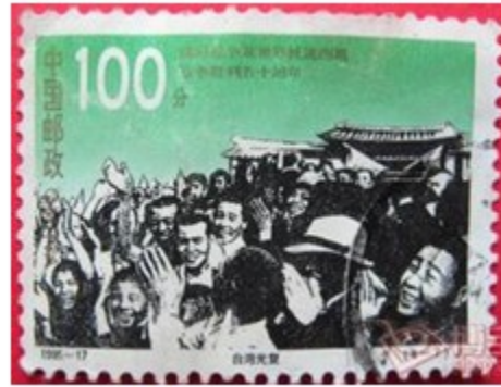
图 15 台湾光复

(2) 观察图 14，该邮票发行的时间是公元多少年？（1分）票面上“庆祝胜利”的含义是什么？（1分）图 15 描绘的是 20 世纪 40 年代中期“台湾光复”的历史场景，结合所学知识，说明为什么称为“台湾光复”（2分）