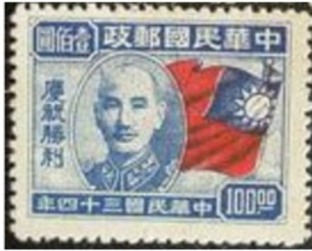
图 14 庆祝胜利