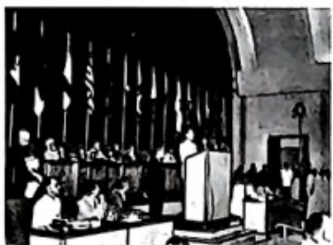
图一 周恩来在万隆会议上发言