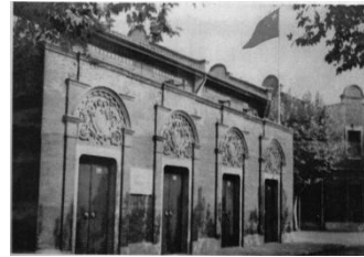
图二 中国共产党第一次全国代表大会会址