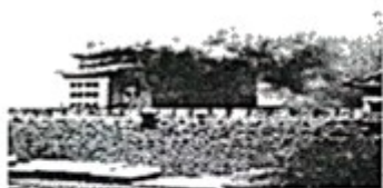
1860年10月15日， 被联军炮轰的北京城墙 图一 北京第一次沦陷

北京作为中国的政治中心，见证了历史风云。近代史上的北京曾饱受列强欺凌，三次沦陷；北京人民表现出了不屈不挠的革命精神和大无畏的英雄气概！