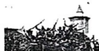
1937年7月29日， 日本侵略军欢呼占领北平 图三 北京第三次沦陷