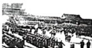
1900年8月14日， 八国联军攻陷北京 图二 北京第二次沦陷