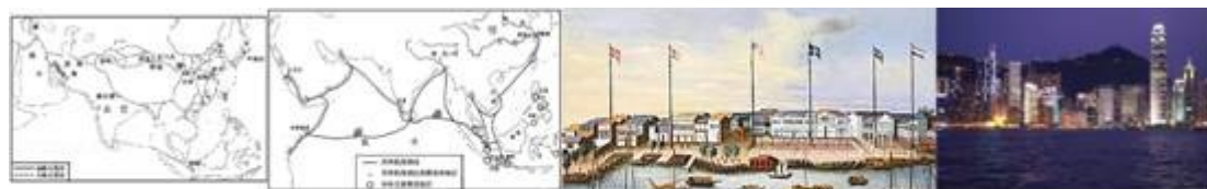
图一 唐朝对外交往 图二 郑和下西洋 图三 广州十三行（油画） 图四 深圳夜景

(2) 根据材料二提供的四幅图，请你概括从古代到现代中国对外交往的主要趋势是什么？