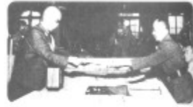
图四 侵华日军代表在南京向 何应钦(右)递交投降书