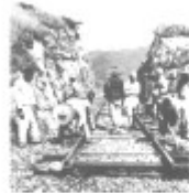
图二 八路军与民兵配合 拆毁正大铁路