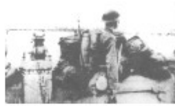
图三 卢沟桥和守卫卢沟桥的 中国第29军士兵