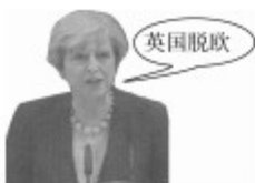
英国首相特雷莎·梅