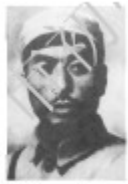
杨靖宇（东北抗日联军第1军军长兼政委）