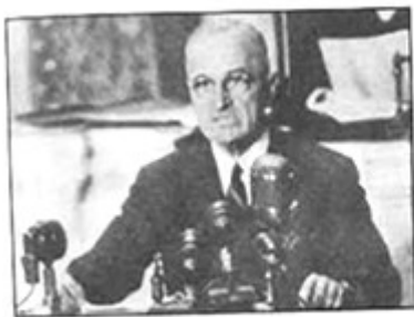
“杜鲁门主义”的提出