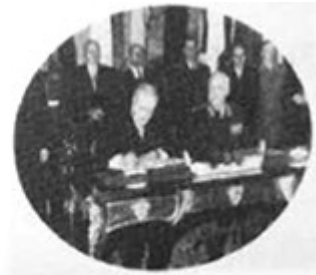
《华沙条约》签字仪式