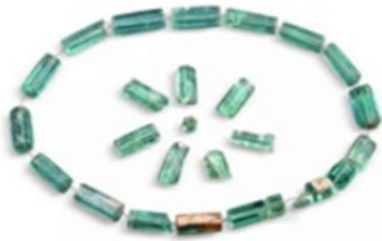
印度六棱柱性玻璃饰