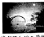
清朝颐和园玉带桥