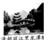
清朝丽江黑龙潭桥