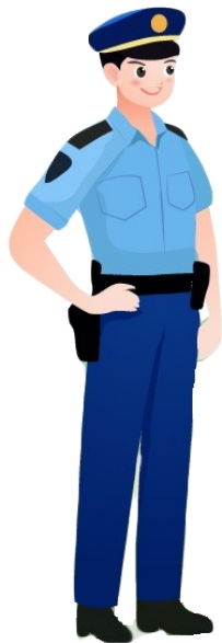
交通运输局 工作人员