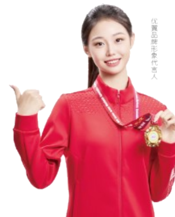
优翼品牌形象代言人

优翼 · 学练优 | 新领程 | 涂重点 | 优翼网 教学资源服务平台 www.youyi100.com