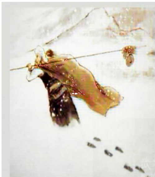
图一：林冲雪夜上梁山

(3) 编写《水浒传》“创意表达”栏目时，需要用一幅插图来表现小说主题。小组同学找到了两幅图片（见右），请选择一幅，写一段 60 字左右的文字，阐述你的看法。（6 分）