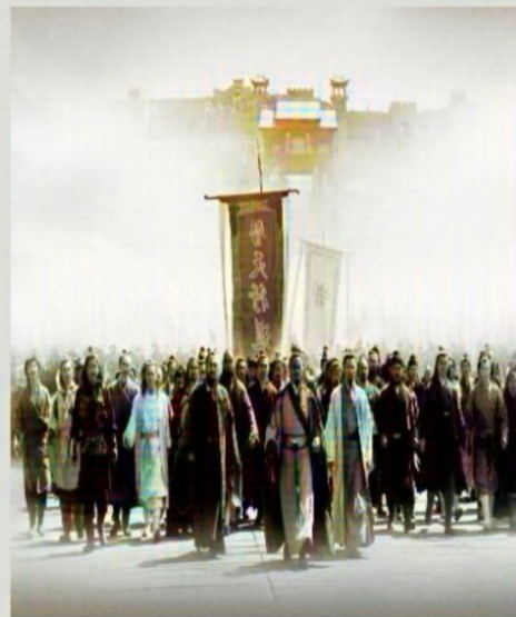
图二：好汉聚义梁山泊