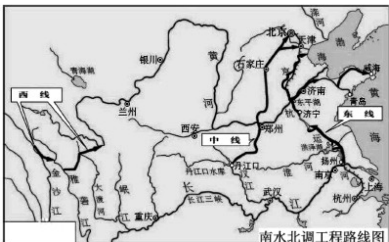
图 2 南水北调工程路线图

13.如果把“北京市地下水埋深为 26.55 米”这一句中的“26.55 米”标注在图 1 上，那应该标注在哪里？（1 分）