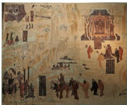
甲：张骞出使西域图