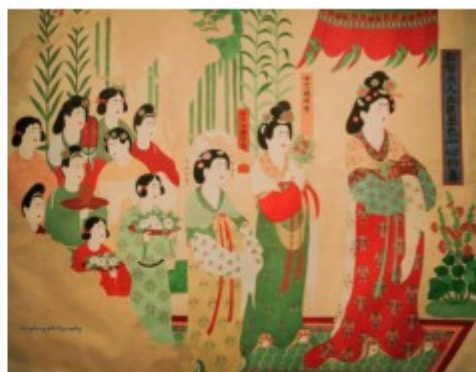
乙：都督夫人礼佛图（复原临摹）