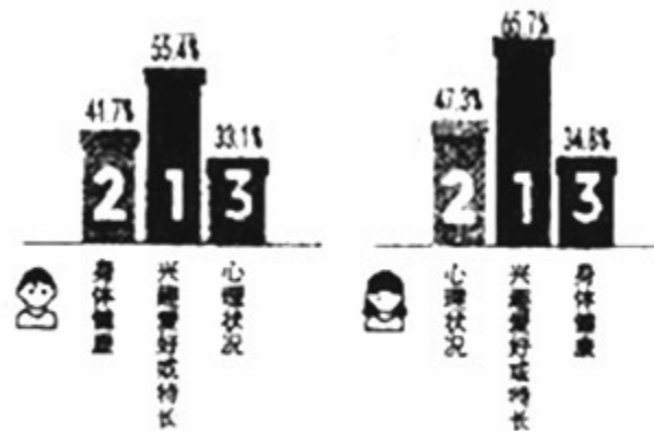
八年级男生和女生最希望家长关注的方面