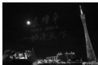
悼念袁隆平的无人机表演

袁隆平说：“人就像种子，要做一粒好种子。”这既是他事业的写照，也是他人生的感悟。袁隆平时刻惦记着的，是让更多的人吃上白米饭，不再饿肚子。他研发的杂交水稻使数百万人脱离了饥饿，他是“真正的粮食英雄”。目前我国“杂交稻”种植面积已达 2.4 亿亩，占比近六成。世界占比不到 9% 的中国耕地，养活了近 1/5 的人口，中国将饭碗牢牢地端在自己手中，这与杂交水稻的功劳密不可分。“谁来养活中国？”以袁隆平为带头人的农业育种科技人员用自己研究与创新的成果“杂交稻”回答了这个问题。