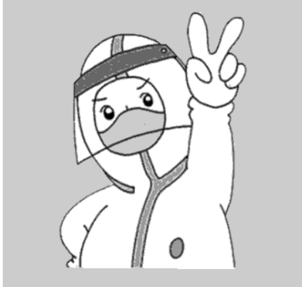
题 3 图