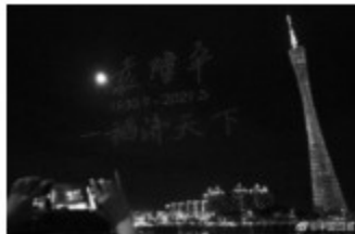
悼念袁隆平的无人机表演

袁隆平说：“人就像种子，要做一粒好种子。”这既是他事业的写照，也是他人生的感悟。袁隆平时刻惦记着的，是让更多的人吃上白米饭，不再饿肚子。他研发的杂交水稻使数百万人脱离了饥饿，他是“真正的粮食英雄”。目前我国“杂交稻”种植面积已达 2.4 亿亩，占比近六成。世界占比不到 9% 的中国耕地，养活了近 1/5 的人口，中国将饭碗牢牢地端在自己手中，这与杂交水稻的功劳密不可分。“谁来养活中国？”以袁隆平为带头人的农业育种科技人员用自己研究与创新的成果“杂交稻”回答了这个问题。