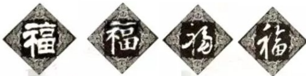
第一幅 第二幅 第三幅 第四幅