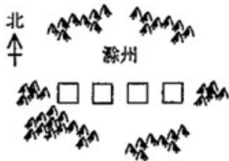
(此图依文意勾画，非实际地图)