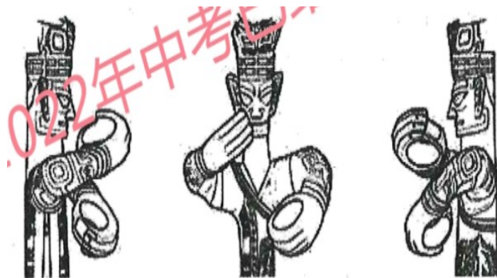
图为作者手绘青铜立人像线图