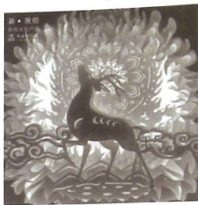
敦煌研究院的九色鹿纸雕夜灯

精巧细致的夜灯、传承古法的彩妆、惊喜连连的“考古”盲盒……“双11”之前，文创产品销量持续攀升，各地博物馆乘着网络东风，再次凭借各种文创产品打开破圈之路。