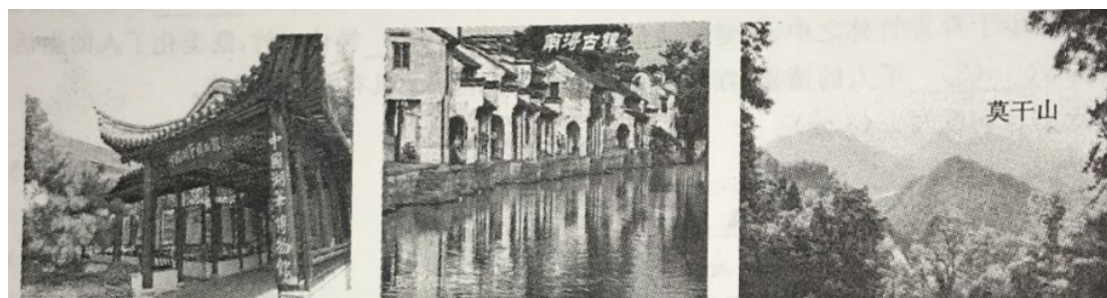
湖笔博物馆 (湖州市中心) 南浔古镇 (市中心往东约 35 公里) 德清莫干山 (市中心往西南约 70 公里)

20. 家住湖州市中心的晓华（化名）同学，家里来了一位中美交流生汤姆。晓华想利用双休日在家长的陪同下带汤姆出去游玩。晓华的家长建议去三个地方（见下图），感受湖州的“山水清丽，文化悠远”。请你根据下面的图片资料，帮助晓华设计“二日游”行程，并用文字表述出来。要求：行程设计合理，有主题；语言表述简洁，有条理；120 字左右。（6 分）