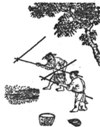
《天工开物》中“打枷图”

【注】①连枷：农具，由一个长柄和一组平排的竹条或木条构成。使用时，操作者将连枷把上下甩动，使连枷拍旋转，来拍打敲击晒场上的作物穗头，使之脱粒。