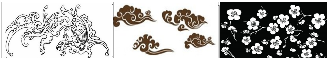
梅花寓意：高洁坚贞的风骨