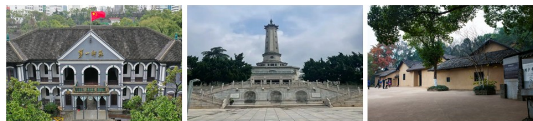
湖南第一师范学院 长沙烈士公园 宁乡刘少奇故居

12. 近年来, 长沙市教育局着力打造“有风景的思政课”, 某校组织学生走进以下场馆, 开展了别开生面的“课程思政”系列活动。