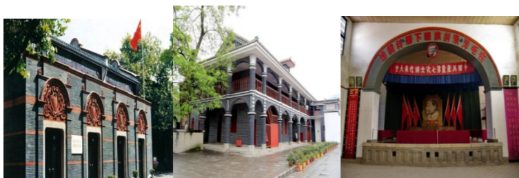
图1 中共一大会址 图2 遵义会议会址 图3 中共七大会场