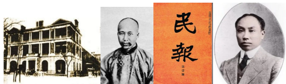
图1 上海轮船招商局 图2 康有为 图3 《民报》 图4 陈独秀

26. （16分）自1840年以来，近一两百年间东西方在思想文化领域不断碰撞，救亡图存和实现现代化成为近代中国人民奋斗的基本目标。从19世纪60年代到20世纪初，重大的探索活动主要有四次。它们共同构成了中国社会向近代化艰难迈进的历史画面。阅读下列图片回答相关问题