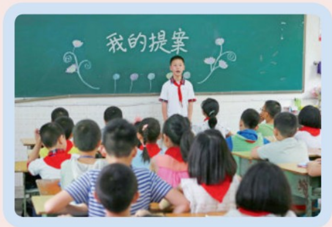
每个人都有提案的权利