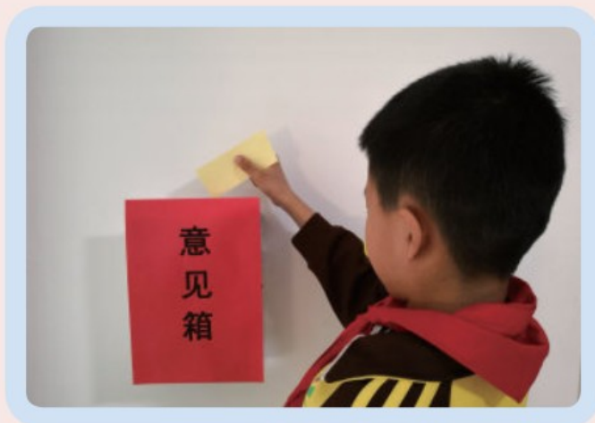
每个人都有提出意见的权利