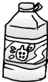
大油瓶 每瓶装 5 kg

6. 学校食堂有 100 kg 油，共装了 28 个瓶子(如下图)，并且每个瓶子 都装满了。请问大、小油瓶各多少个？