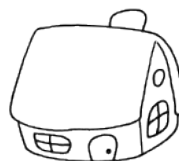
每间小房住 4 只