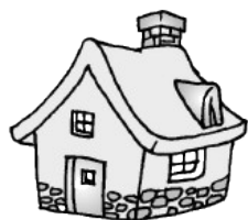
每间大房住 6 只