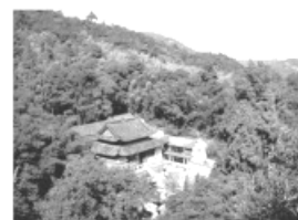
南岳衡山 1.29 km