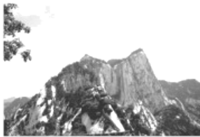
西岳华山 2.16 km