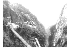
中岳嵩山 1.44 km