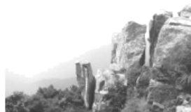
东岳泰山 1.545 km