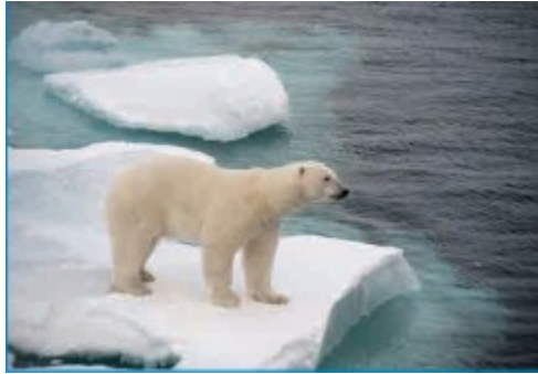
北冰洋的浮冰面积在退缩