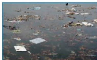
水资源短缺与水污染