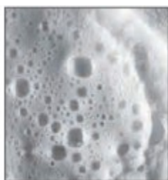
小苏打和白醋混合